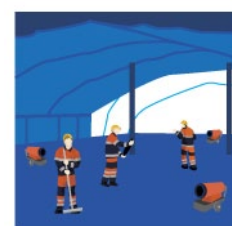
Rys. 2. Wykonywanie prac pod cieplakiem