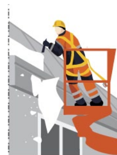
Rys. 4. Usuwanie śniegu z elementu budynku przez pracownika w podnośniku koszowym