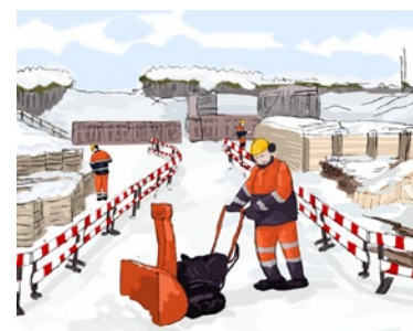
Rys. 3. Odsnieżanie ciągów komunikacyjnych